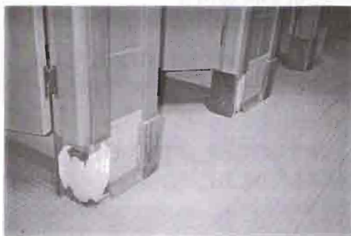
Acabado de rodapié