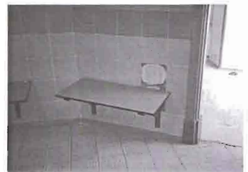
Bancos que rompen azulejos.