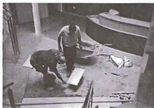
Cambio de baldosas de recepción