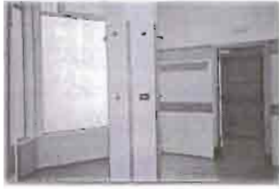
Duchas, grifos sin ninguna separación.