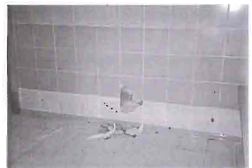
Azulejos vestuarios rotos.