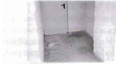
La limpieza aumenta de 8 a 28 millones.

ESTOS SON LOS ACABADOS DE UNA INSTALACIÓN QUE HA COSTADO CERCA DE 700 MILLONES DE PESETAS.